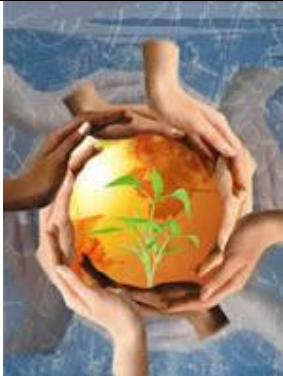
گروه درمانی به شیوه گشتالتی

موسسه روانشناسی دانشکده روانشناسی و علوم تربیتی دانشگاه تهران برگزار می کند :