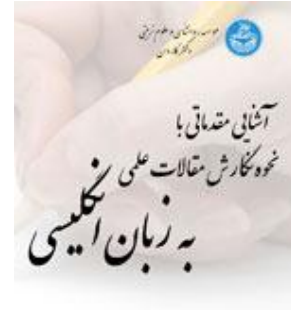
کارگاه آشنایی مقدماتی با نحوه نگارش مقالات علمی به زبان انگلیسی