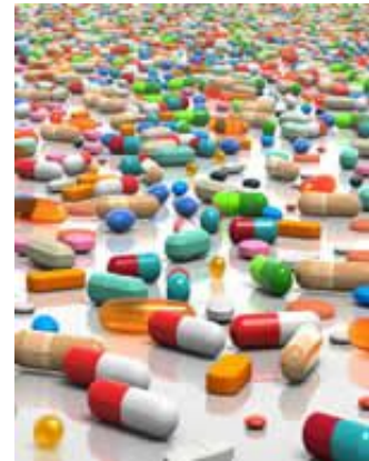
رواندرمانی جامع ماتریکس