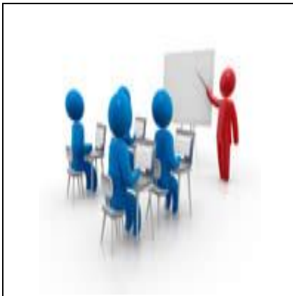
مقاله نویسی به سبک APA

موسسه روانشناسی دانشکده روانشناسی و علوم تربیتی دانشگاه تهران برگزار می کند :