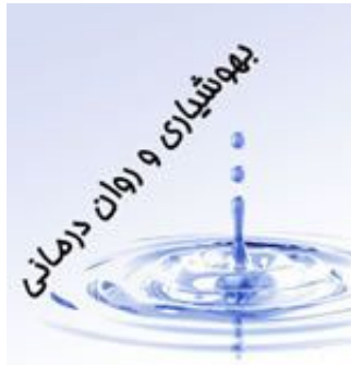
بهبود شیاری و روان درمانی: نظریه و عمل