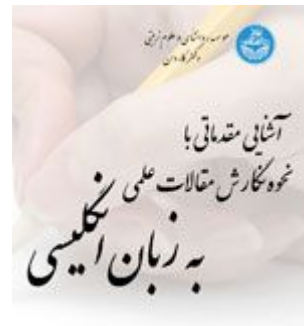
کارگاه آشنایی مقدماتی با نحوه نگارش مقالات علمی به زبان انگلیسی