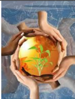
گروه درمانی به شیوه گشتالتی

موسسه روانشناسی دانشکده روانشناسی و علوم تربیتی دانشگاه تهران برگزار می کند :